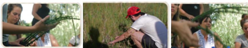
Figura 3. Proceso de producción de “Manos que curan”

Estas narrativas se construyen a partir de relatos que se posicionan como parte de las tácticas de resistencia. Esto implica sostener, mediante la tradición oral, el conocimiento intergeneracional de las familias campesinas sobre cómo curar y curarse. Además, estas prácticas actúan como formas de re-existencia, desplegándose para cuidar la vida humana, la de otros seres vivos, y toda la materialidad que constituye el entorno habitado, ampliando así las concepciones del cuidado de la salud más allá de la mera ausencia de enfermedad.