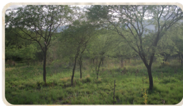
Figura 2. Proceso de producción de “Manos que curan”.

En ese marco, generar diálogos para una “conversación” -en tanto corporalidades y sus relaciones con las materialidades del territorio: naturaleza y otros seres vivos- implica reconocerse desde una perspectiva situada. Es decir, desde los territorios subalternizados y cuerpos cercados por el avance de regímenes extractivistas y que han intervenido en el tejido de la vida (Moore, 2015) mediante la eliminación y desarticulación de formas de vida, tanto humanas como no humanas. Esta relación entre lo humano y no humano se organiza en relación de interdependencia y son fundamentales para asegurar la sostenibilidad de la vida (Navarro Trujillo, 2019).